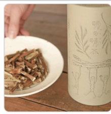
アスパラガスのお茶 「明日晴茶」