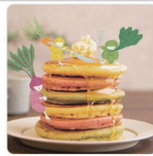
忍んでいるのは伊賀のお野菜 「忍者パンケーキ」