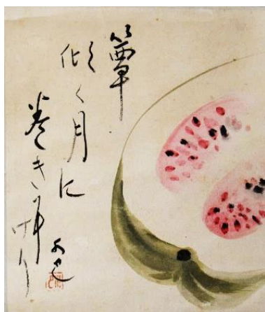
渡辺水巴筆「簞」発句画賛 （伊賀市蔵）