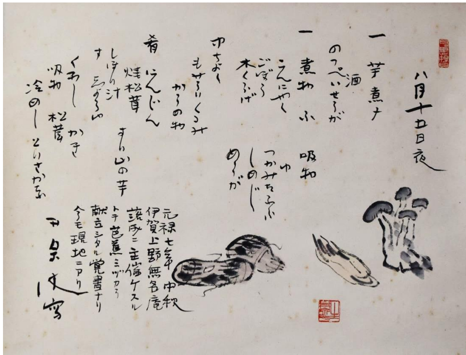
荻原井泉水筆 芭蕉月見の献立（芭蕉翁顕彰会蔵）